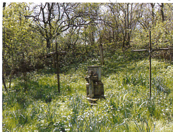
Widok od strony północno – wschodniej.