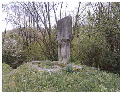
Widok od strony północno – zachodniej.